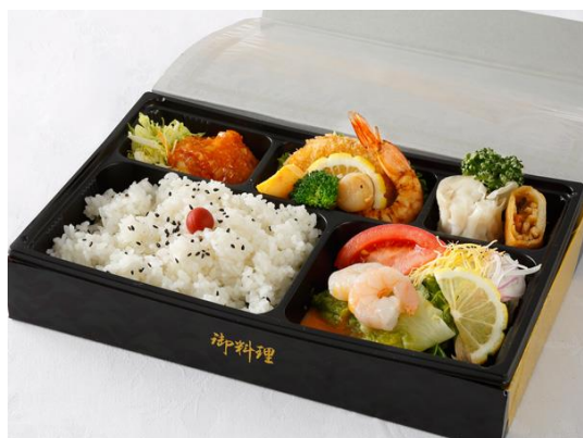
折詰め弁当 洋中 1名様2,000円