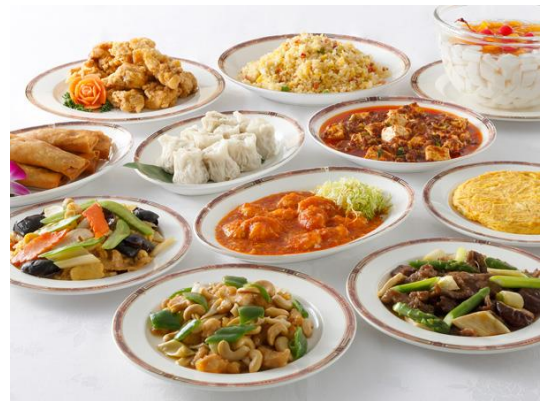
中国料理メニュー例