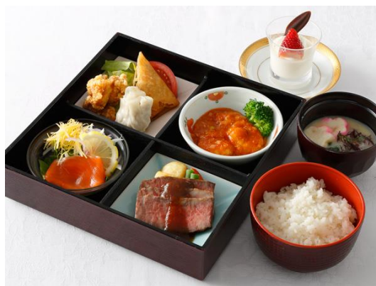
松花堂弁当 竹 洋中 1名様3,000円