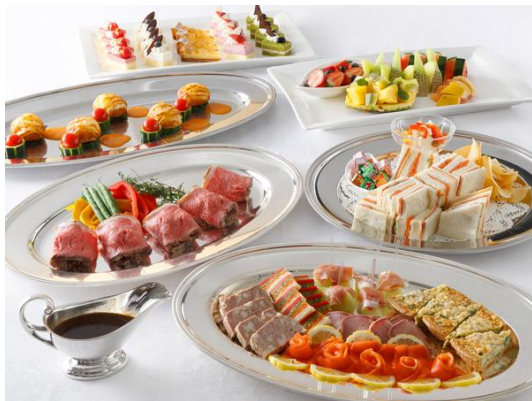
洋食メニュー例(各5名様)