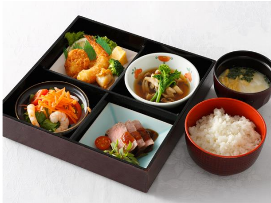
松花堂弁当 梅 洋食 1名様2,500円