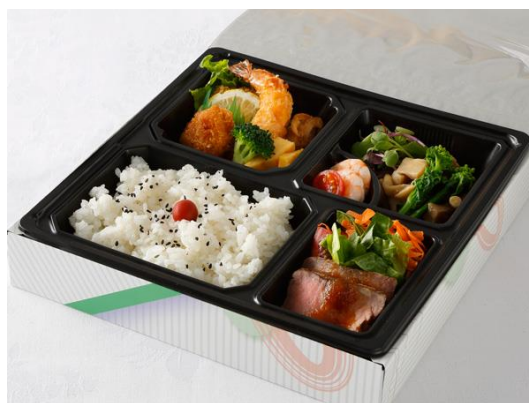
折詰め弁当 洋食 1名様2,000円