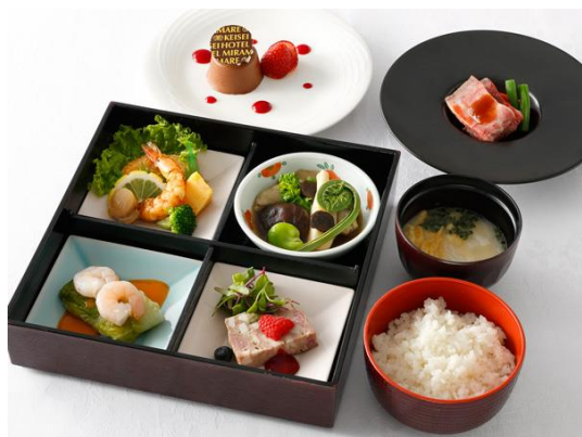
松花堂弁当 松 洋食 1名様3,500円